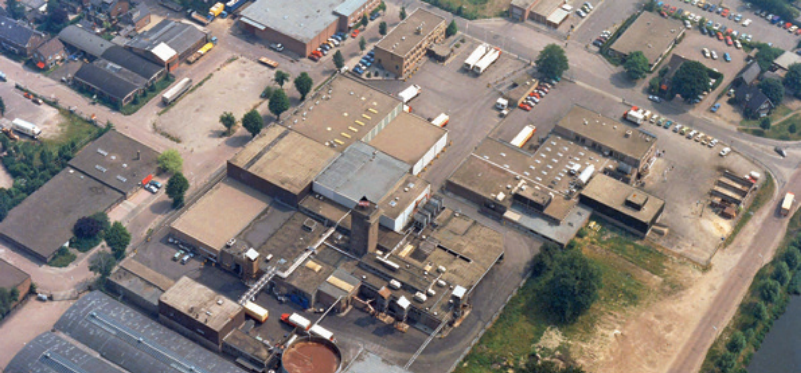
De EKRO in 1986. Duidelijk is te zien dat het oude gebouw in de loop der jaren is ingekapseld door aangebouwde bijgebouwen. De oorspronkelijke architectuur is uit het zicht geraakt.

was blijven staan was Welgelegen een prachtig gebouw - in de woorden van Stefan Rutten een juweel- rijker geweest in een voor Apeldoorn bijzondere bouwstijl, dat niet had misstaan in de moderne architectuur van Welgelegen-west. Helaas.