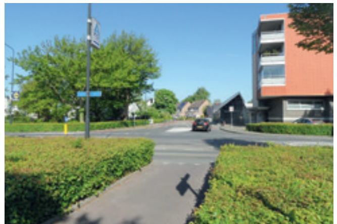
Huidige situatie kruising Auroralaan - Wapenrustlaan.