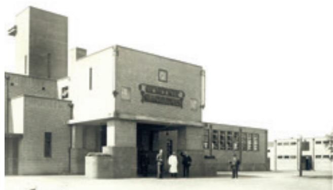
Voorgevel Gemeentelijk Slachthuis circa 1935, architectuur en materiaal - bakstenen - zijn karakteristiek voor de Amsterdamse school.

Hooyers slachthuis, ooit gelegen aan de niet meer bestaande Slachthuis(dwars)straat (zie kaartje) was bij oplevering een juweel voor de stad, een even strak als elegant gebouw, spaarzaam en smaakvol versierd met enkele reliëfs, elegante smeedijzeren letters en een klok.