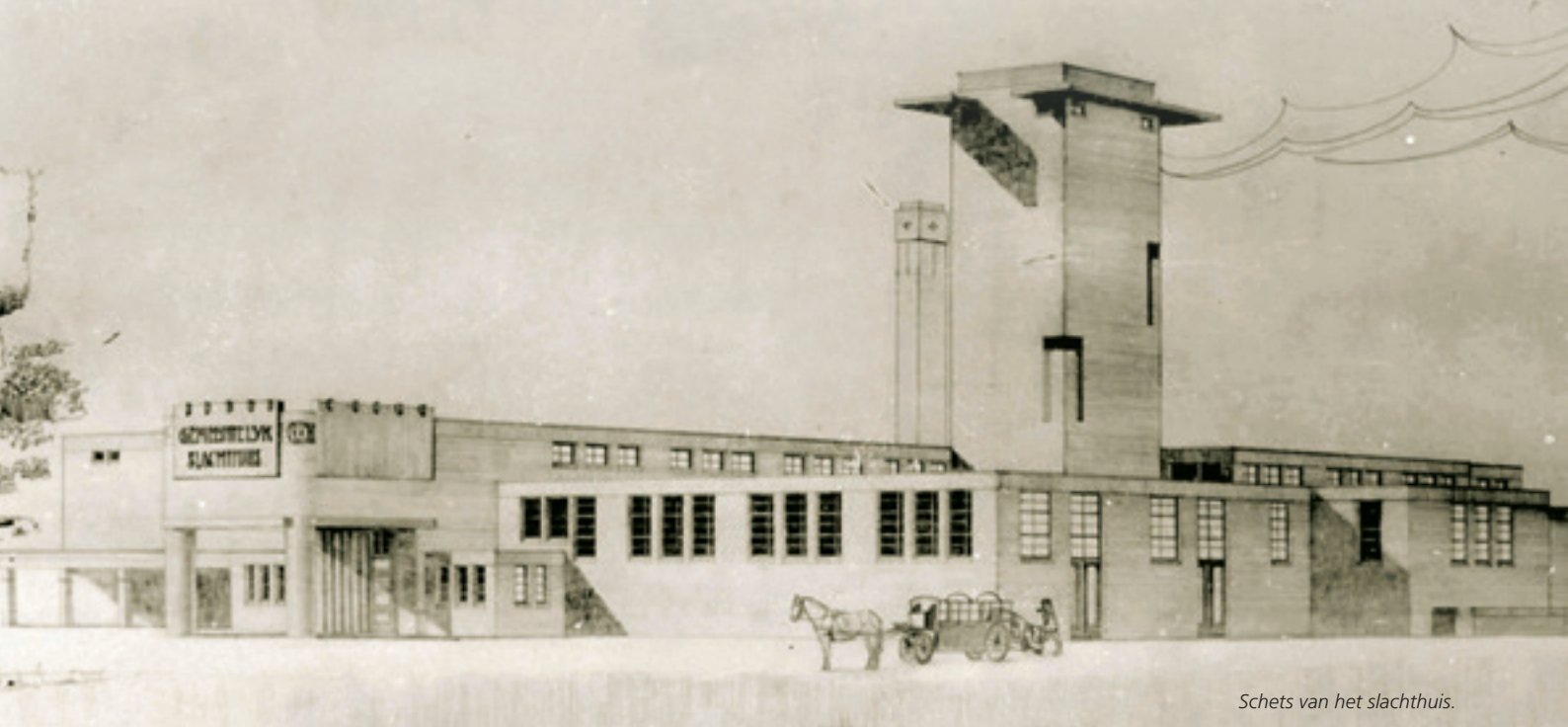
Schets van het slachthuis.