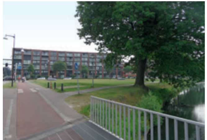
Kijkend naar het zuiden tussen Quarles van Uffordlaan en kanaal de bouwlocatie van De Admiraal.

Tenslotte, tussen het Kanaalpad en Burgemeester Jhr. Quarles van Uffordlaan ligt nog een strook bouwgrond bestemd voor kantoorvilla's. Op de plek waar de Burgemeester Jhr. Quarles van Uffordlaan de Deventerstraat