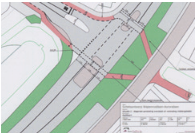
Voorkeursplan herinrichting kruising Auroralaan - Wapenrustlaan.