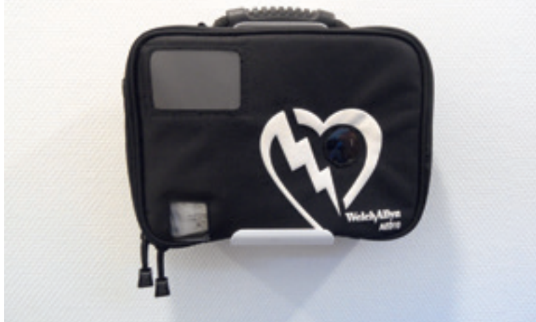
Foto AED bij het Gezondheidscentrum Welgelegen aan de Baron Sloetkade. De AED bevindt zich in de huisartsenpraktijk van het centrum.

In de database van het Rode Kruis staan op dit moment slechts 26.807 AED's geregistreerd, terwijl er in heel Nederland tussen de 80.000 en 100.000 AED's verkocht