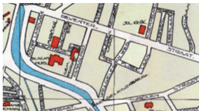
Locatie slachthuis in Welgelegen (kaart circa 1930).

Maar in de loop der jaren heeft het slachthuis veel te lijden gehad. In de oorlog liep het enige schade op, maar die was overkomelijk. Het 25-jarig bestaan in 1952 werd weer trots gevierd. Bij die gelegenheid bood de Slagerspatroonsvereniging een nieuwe klok aan.