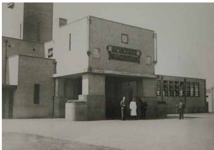
Gemeente slachthuis