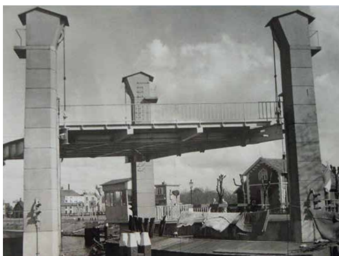
Welgelegenbrug, foto CODA Apeldoorns archief.